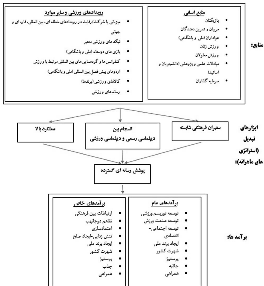
شکل ۱- مدل مفهومی اعمال قدرت نرم از طریق دیپلماسی ورزشی

از منابع دیپلماسی ورزشی که ادبیات پژوهش اهمیت ویژه ای برای آن قائل شده است، میزبانی رویدادهای بزرگ ورزشی به ویژه بازی های المپیک و جام جهانی فوتبال است (عبدی طالب پور، فولرتون، رنجکش و جباری، ۲۰۱۹). در بازی های المپیک بیش از ۲۰۰ کمیته ملی المپیک شرکت می کنند. افتتاحیه و مسابقات برای ۲۲۰ کشور و سرزمین در سراسر جهان پخش می شود و حدود چهار میلیارد نفر تماشاگر را به خود جذب می کند (آرینگ، ۲۰۱۳، ۵۲۵). به هزاران نفر از روزنامه نگاران برای