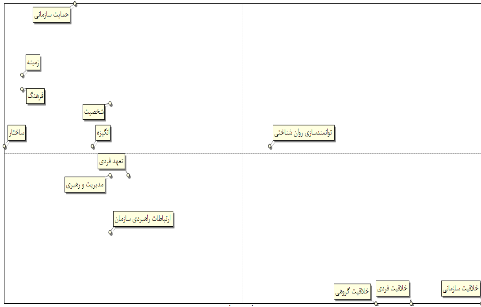
شکل ۱- ارائه مدل زمینه‌ای خلاقیت پایدار در وزارت ورزش و جوانان (تعیین مفاهیم اثرگذار و اثرپذیر)