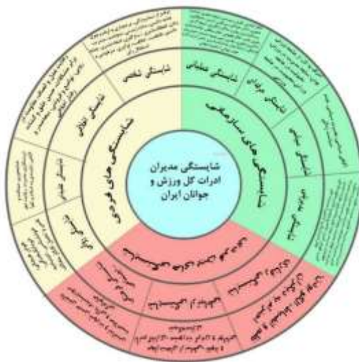
شکل ۳- الگوی نهایی شایستگی‌های مدیران ادارات کل ورزش و جوانان ایران

در نهایت، الگوی شایستگی مدیران ادارات کل ورزش و جوانان به صورت زیر ارائه می‌گردد.