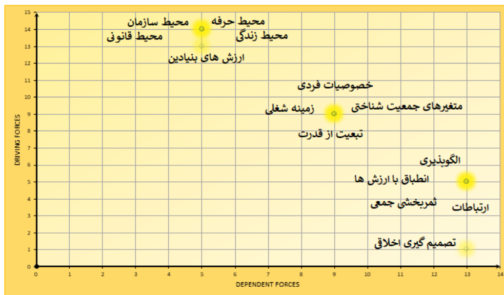
شکل ۲- میزان نفوذ و وابستگی عوامل مؤثر بر تصمیم‌گیری اخلاقی بازیکنان فوتبال

سرانجام جهت شناخت تحلیل سیستمی عوامل مؤثر، میزان نفوذ و وابستگی آنها با استفاده از میک‌مک محاسبه شد که نتایج آن به شرح شکل (۲) بود.