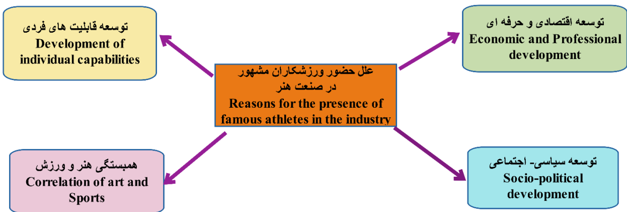
شکل ۱- علل حضور ورزشکاران مشهور در عرصه صنعت هنر