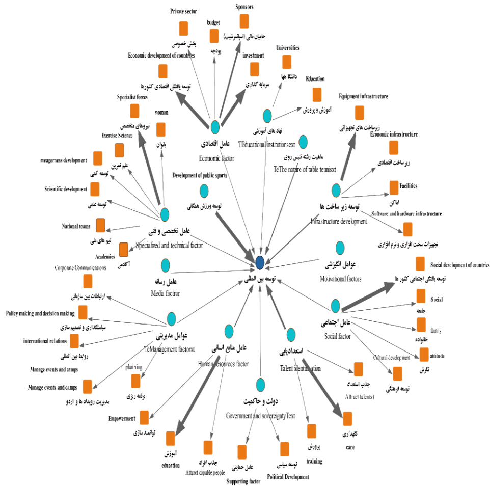
شکل ۲- نمودار درختی عوامل مؤثر بر توسعه بین‌المللی تنیس روی میز ایران Figure 2- Tree Diagram of Factors Affecting the International Development of Table Tennis in Iran

شکل شماره دو مدل برگرفته از کشف و احصای عوامل مؤثر بر توسعه بین‌المللی تنیس روی میز ایران در محیط نرم‌افزار است. همان‌طور که در این شکل پیداست، توسعه ورزش همگانی به صورت معناداری بر توسعه بین‌المللی تنیس روی میز ایران تأثیرگذار است. پس از آن، مقوله استعدادیابی به عنوان عامل مهم به توسعه بین‌المللی تنیس روی میز ایران منجر می‌شود. عامل منابع انسانی و ماهیت رشته تنیس روی میز نیز از اهمیت بیشتری برخوردارند. در ادامه با استفاده از الگوی اشتراوس