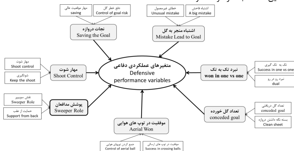
شکل ۱- مدل استخراجی متغیرهای عملکردی دفاعی دروازه‌بان

صورت گرفت تا مفاهیمی که با هدف محقق در یک راستا بود و بهره‌گیری از آن‌ها نتایج ثمربخش‌تری در فرایند تحقیق داشت، به کار گرفته شود.