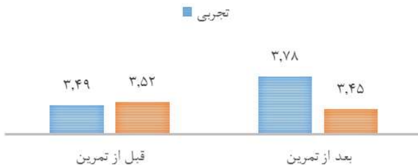
شکل ۱- میانگین استرس شغلی گروه تجربی و گروه کنترل در قبل و بعد از تمرین

برای درک بهتر، شکل شماره یک ارائه شده است. در جدول شماره چهار، نتایج آزمون تی مستقل برای مقایسه تغییرات استرس شغلی دو گروه گزارش شده است.