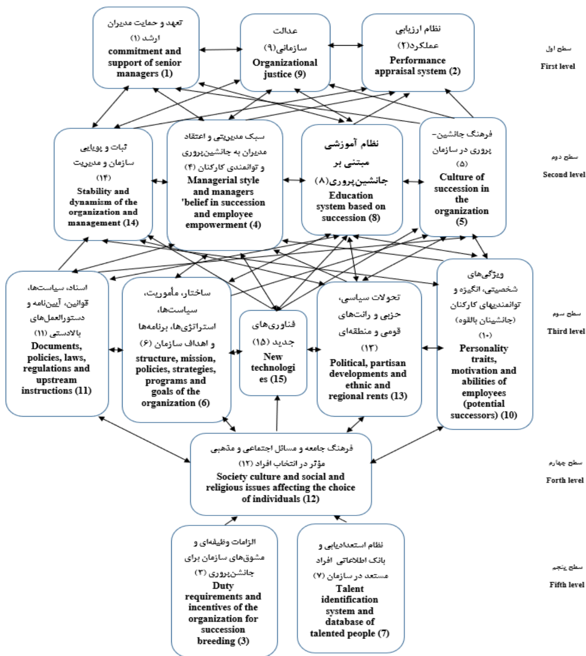
شکل ۲- مدل ساختاری تفسیری جانشین‌پروری در ادارات ورزش و جوانان