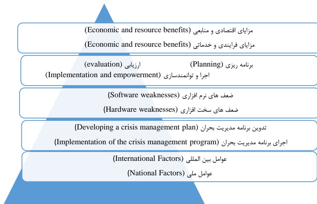
شکل ۱- مدل کیفی توسعه مدیریت بحران در اماکن ورزشی براساس سیستم پشتیبان تصمیم