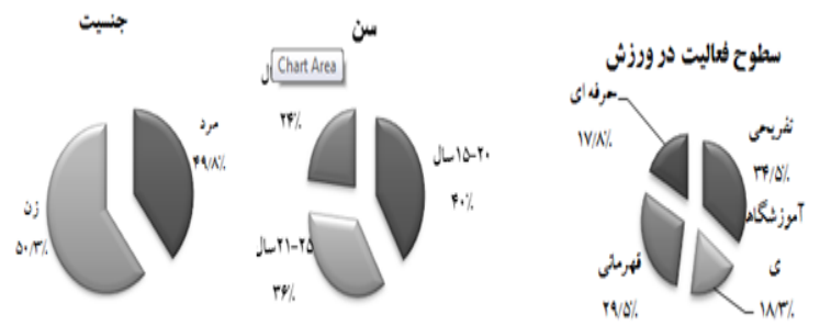
شکل ۴: نمودار دایره‌ای متغیر وضعیت سطوح مشارکت. شکل ۳: نمودار دایره‌ای متغیر سن در نمونه. شکل ۲: نمودار دایره‌ای متغیر جنسیت در نمونه.

نتایج نمودارهای ۲، ۳ و ۴ نشان می‌دهند که در این پژوهش، توزیع پاسخگویان برحسب جنس تقریباً برابر بوده است (حدود ۴۹٪ مرد و ۵۱٪ زن). بیشترین فراوانی پاسخگویان (حدود ۴۰٪) در گروه سنی ۱۵-۲۰ سال بود و به‌طور کلی، حدود ۷۶٪ از پاسخگویان بین ۱۵ تا ۲۵ سال سن داشتند. همچنین بیشترین فراوانی نمونه‌های پژوهش حاضر (حدود ۳۵٪) متعلق به گروهی بوده است که در سطح تفریحی و همگانی به فعالیت در ورزش می‌پرداختند و کمترین فراوانی افراد (حدود ۱۸٪) مربوط به گروهی بود که اعلام کرده بودند در سطوح حرفه‌ای در ورزش مشارکت دارند.