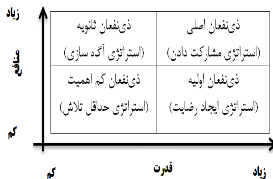
شکل ۱- ماتریس منافع- قدرت

قدرتی که ذی‌نفع در دست دارد و بر محور عمودی منافع (علاقه) است که از سازمان کسب می‌کند، قرار می‌گیرد و براساس میزان کم تا زیاد، چهار گروه ذی‌نفع طبقه‌بندی می‌شود (کیویتس ۱ ، ۲۰۱۳، ۳۵) (شکل شماره یک).