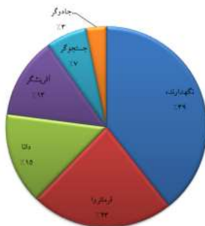
شکل ۳- کهن‌الگوی مطلوب سازمان لیگ

جدول شماره سه نشان می‌دهد که ادارک شخصیت برند سازمان لیگ از طریق دو مقوله تجربه و ارتباطات برند برای افراد عینیت یافته است. همچنین، مؤلفه‌های مدیریت و برنامه‌ریزی، منابع سازمانی، ماهیت سازمانی و ویژگی‌های شخصی مدیر به ادارک از طریق تجربه منجر می‌شوند و ارتباطات، تأثیرات محیط و تأثیرات باشگاه‌ها از طریق ارتباطات برند به ادارک شخصیت منجر می‌شوند.