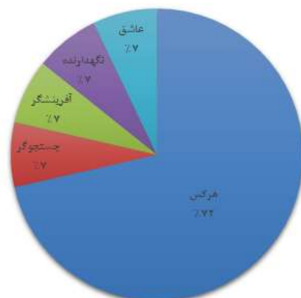
شکل ۲- کهن‌الگوی کنونی سازمان لیگ