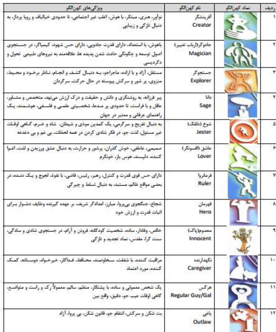
شکل ۱-۱۲ کهن‌الگوی کمپل