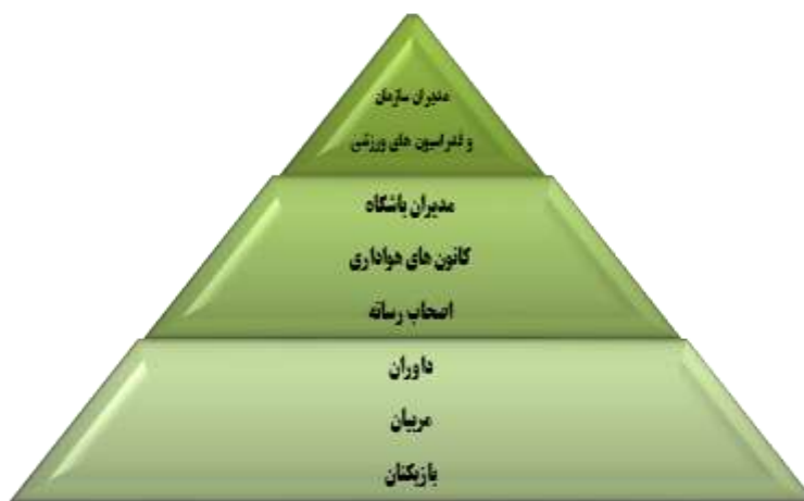
شکل ۳- هرم پیشنهادی برگرفته از مدل مفهومی و یافته‌های پژوهش

مفهومی انجام شود که در سطح خرد، بازیکنان، مربیان و داوران می‌توانند جامعه هدف آموزش درزمینه آشنایی با قوانین و شناساندن خطوط قرمز باشند. در سطوح میانی نیز مدیران باشگاه‌ها، کانون‌های هواداری و کارکنان می‌توانند جامعه هدف آموزش قرار گیرند و در سطح کلان نیز مدیران سازمان‌های ورزشی و فدراسیون می‌توانند جامعه هدف آموزش قرار گیرند که در هرم آموزش کاهش فساد در شکل مشاره سه مشاهده می‌شود: