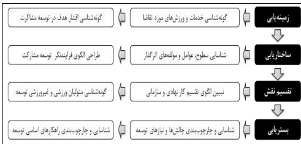
شکل ۱- چهارچوب تحلیل مفهومی پژوهش

مدل‌های توسعه‌ی زیادی در زمینه‌ی ورزش همگانی ارائه شده‌اند؛ اما تاکنون مدل و الگوی جامعی که بر توسعه‌ی مشارکت ورزشی تأکید کند، ارائه نشده است. به‌ویژه اینکه در استان گیلان، تاکنون چنین مطالعاتی باوجود برخورداری این استان از شرایط اقلیمی مناسب برای پرداختن به انواع الگوهای ورزش همگانی و تفریحی انجام نشده‌اند. به‌طورکلی، نتایج پژوهش‌های انجام‌شده در ورزش استان‌های کشور نشان داده است که فقدان سیاست‌ها، خط‌مشی‌های راهبردی، نبود هماهنگی بین مجموعه‌ی نهادها، سازمان‌ها و دستگاه‌های اجرایی مرتبط با ورزش، ناکافی‌بودن منابع مادی و انسانی در حوزه‌های مختلف ورزشی، گاهی انجام کارهای موازی و نبود نظارت کافی بر فعالیت‌های ورزشی، ازجمله مهم‌ترین نارسایی‌های این بخش محسوب می‌شوند؛ بنابراین، پژوهش حاضر درصدد است که براساس مطالعه‌ی تفصیلی و جامع با رویکرد پیمایشی و زمینه‌ای در سطح مشارکت ورزشی استان گیلان، به نظام‌مندسازی منظرها و رویکردهای توسعه‌ی مشارکت ورزشی بپردازد. چهارچوب تحلیل مفهومی و محتوای پژوهش، در قالب سه رویکرد اصلی زمینه‌یابی، ساختاریابی و چهارچوب‌بندی عامل‌ها، شاخص‌ها و رویکردهای توسعه‌ی مشارکت ورزشی، به‌صورت شکل شماره ۱ یک ترسیم شده است. این چهارچوب، حاصل نظام‌مندسازی محتوا و فرایند این پژوهش براساس اصول پژوهش در مدیریت ورزشی است.